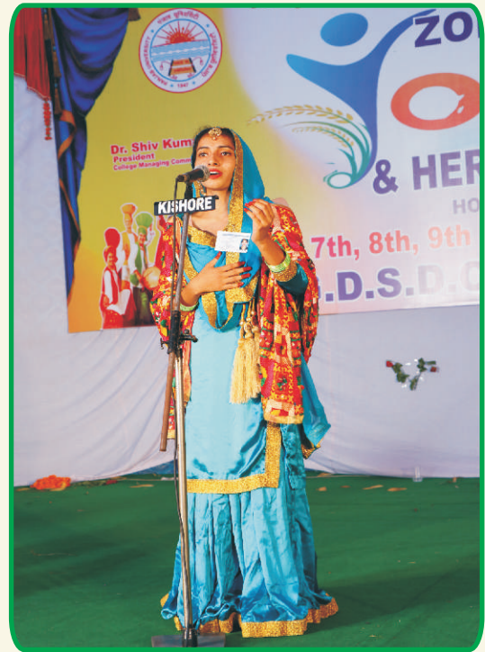
Folk Song in College Youth Festival