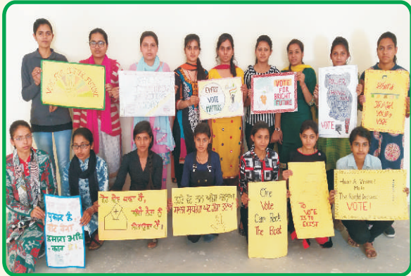
Slogan & Poster Competition in College Youth Festival